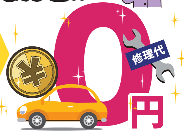
※保証に含まれない修理代は有料です。